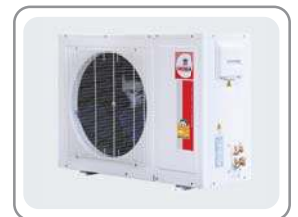
CONDENSING MODEL : CCS-32BF