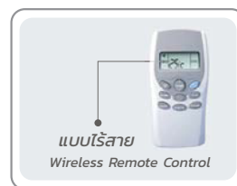
แบบไร้สาย Wireless Remote Control