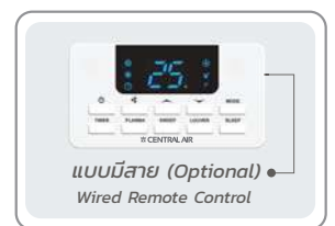
แบบมีสาย (Optional) Wired Remote Control