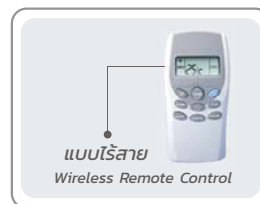
แบบไร้สาย Wireless Remote Control