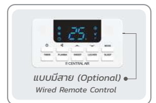
แบบมีสาย (Optional) Wired Remote Control