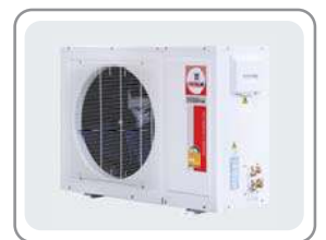
CONDENSING MODEL : CCS-32IBW