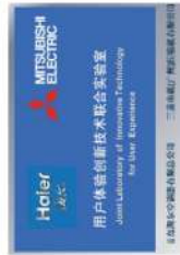
Haier & Mitsubishi Joint Laboratory