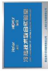
Haier & HICHLY Joint Laboratory