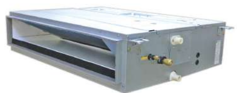
Ducted Type DKM SERIES