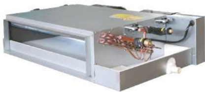
Concealed Type DCC SERIES