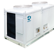
CVA 200,000 -300,000 BTU/HR