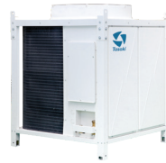
CVA 75,000 -150,000 BTU/HR