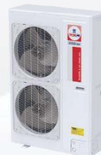
Model : CCS-32IVGX60