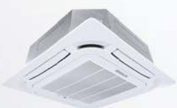
Model : CFC-32IVGX13