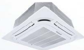
Model : CFC-32IVGX18, 24, 30