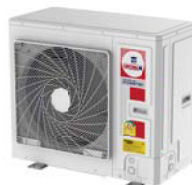
Model : CCS-32IVGX40, 48