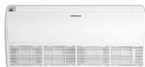
Model : CFH-32IVGX36, 40, 48, 60