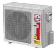
Model : CCS-32IVGX36