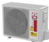
Model : CCS-32IVGX24, 30