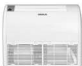
Model : CFH-32IVGX13, 18