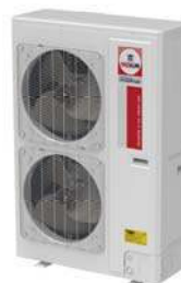
Model : CCS-32IVGX60