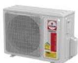
Model : CCS-32IVGX13, 18