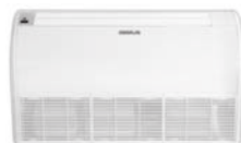
Model : CFH-32IVGX24, 30