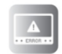
Error Code Display